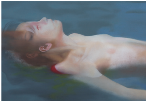
《30.02%》 2025年 油彩、キャンバス 作家蔵