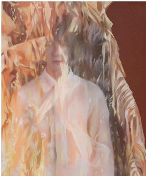
《 / 115 》 01 2026年 油彩、キャンバス 作家蔵