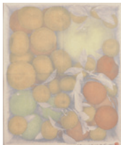
(左)野田 哲也《Diary, Dec. 21st '03 (b)》2003年 木版・シルクスクリーン 紙 (右)上野 豊《松合の踏切》2001年 水彩・紙 いずれも不知火美術館蔵