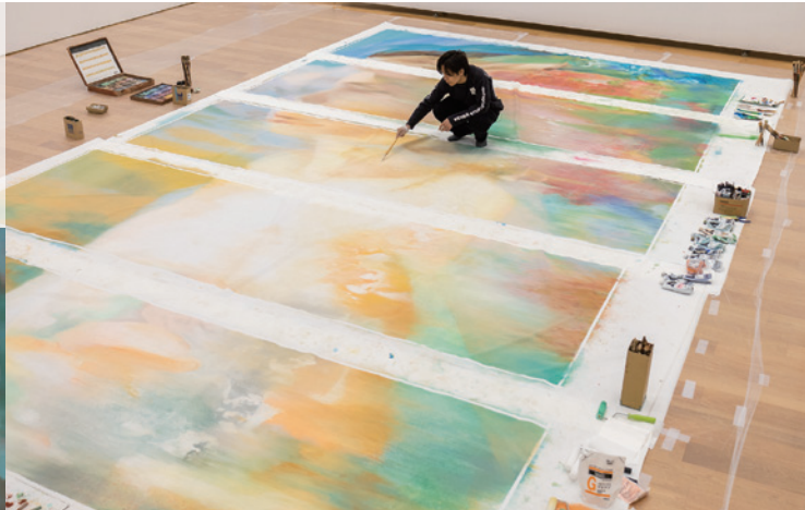
《しらない》公開制作風景 (2026年3月)

各イベントの詳細は随時公式ウェブサイトやSNSでお知らせします。 【要予約】のイベントは7/1より公式ウェブサイトにて予約受付開始。