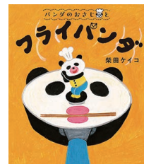
『パンダのおさじとフライパンダ』 柴田ケイコ／著 ポプラ社 2023年5月