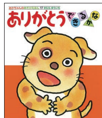
『ありがとうできるかな』 きむらゆういち／著 偕成社 2023年4月