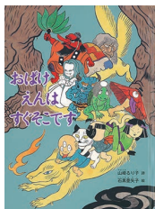
『おばけえんはすぐそこです』 山崎るり子／著 石黒亜矢子／絵 福音館書店 2023年5月