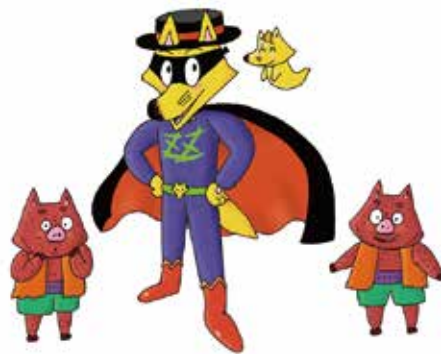
かいけつゾロリ©原ゆたか/ポプラ社