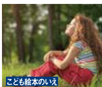
こども絵本のいえ

暑い夏を乗り切るアイデアを 図書館で探そう！旅行やレ ジャー、おうち時間を快適に 過ごすための本を集めました。